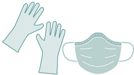
Equipo de protección personal