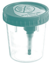
Copa de recogida de orina