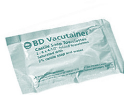
Toallita de jabón de Castilla