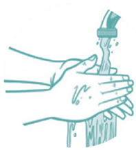
Lavarse las manos